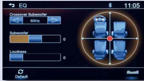
Tiefpass für den Subwoofer