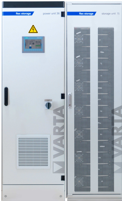
Abbildung 1: E 36/75 – beispielhafte Darstellung (Abbildung ähnlich)